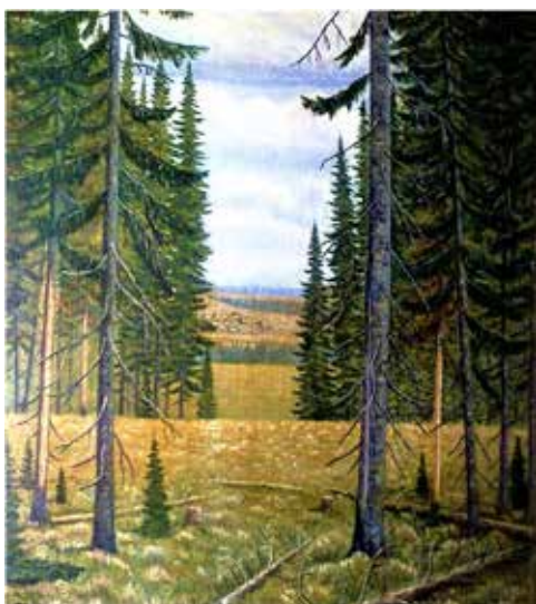
Кач кульöм пуяс

Кутi корсьысьны война йылысь серпасьяс. Öд 1944 восянь 1951 воöдз сiйö вөлөма Ыдждыд тыш вылын. Аддзи сöмын кыкöс. Öтиас Белоруссияын