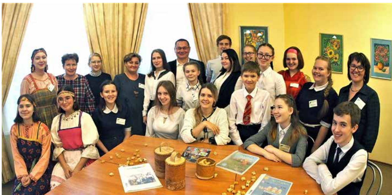
Горадзульки. Октябрь 2019 г.