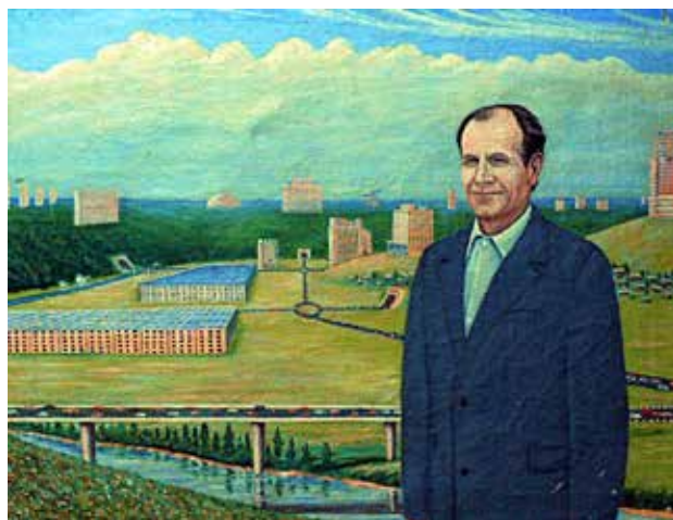
Сордйыв 2099 воын