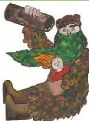
«Похититель Яг-Морт». Рисунок Доминики МАРТЫНОВОЙ