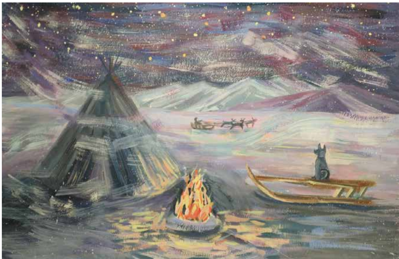
«Сказка тундры». Рисунок Марии ПОПОВОЙ