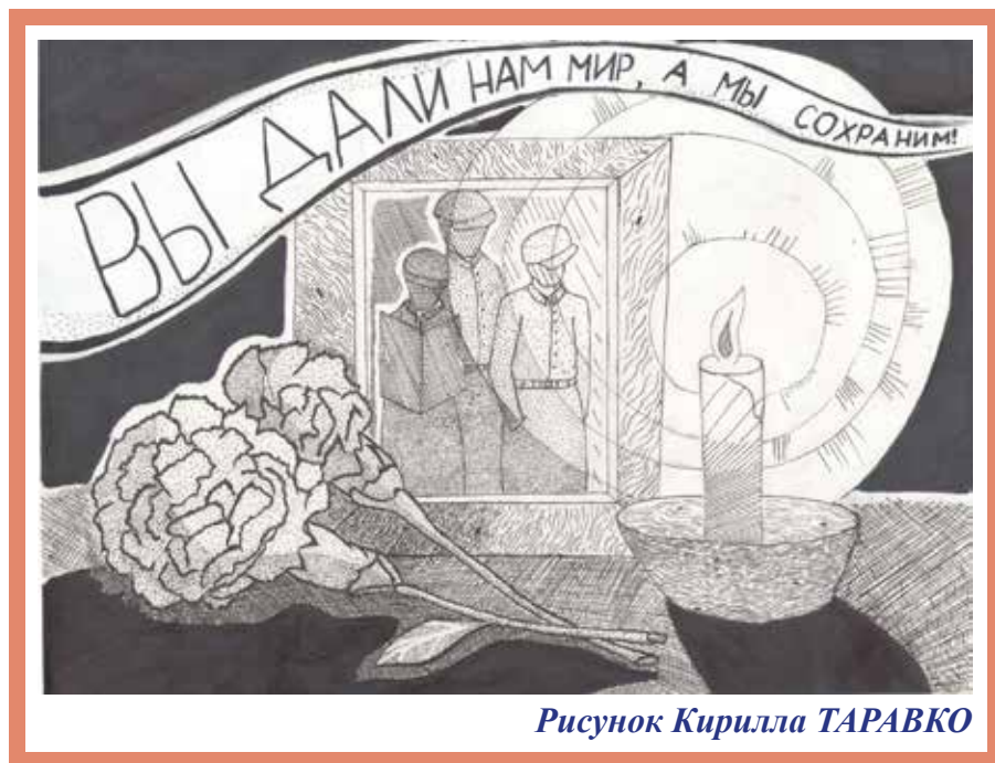
Рисунок Кирилла ТАРАВКО

Дас кык арöса нывкалы сетасны дöзьöритны кызь квайт душ кукань. Аслас висьталöм серти, Аннук ворсöма накöд дзебсясьöмысь. Мича куканьяс кажитчöмаöсь збой радлысь нывкалы ас кодъыс жö челядьөн. Öнi на тшöкыда, нюмъялигтырйи, казьтывлö куканьяскöд дзебсясьöмөн ворсöм йылысь. Бура куканьясöс быдтöмысь да дöзьöритöмысь, кодъясöс аслас вынён вайöдöма мöсьясöдз, сетасны ыджыд мамöлы премия – кукань, кодöс нимтас Веткаөн. Быдтасны куканьсö мöскöдз. Ветка вöлöма сюртöм, сьöда-еджыда сера, шань, уна йöла бур мöскөн. Мöс-кöрмиличаöс радейтöмаöсь семьян ставөн. Öти гожся рытö Ветка абу локтöма гортас. Корсьöмаöсь чукöрөн нель вой да лун, но мöстö сiдзи и абу адзö-