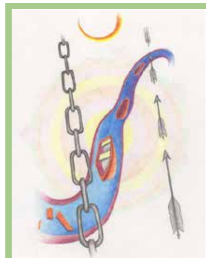
Рисунок Ульяны ВИШЕРАТИНОЙ