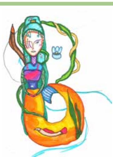
«Васа». Рисунок Эмили ТОРЛОПОВОЙ

Но өд Войпель – менам батьёй, А мамөй менам – чужан му!