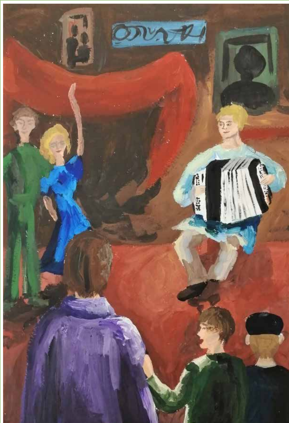
«Эх, гармонь!» Рисунок Софьи КЛЕМЕШЕВОЙ