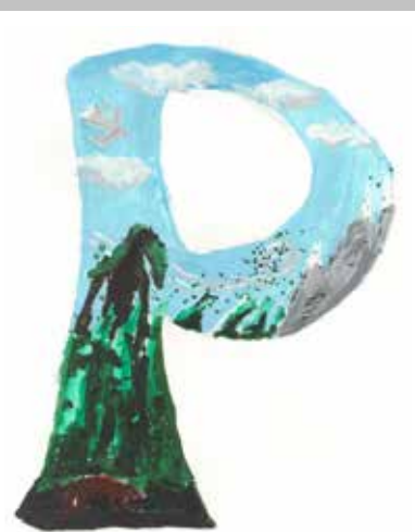
«Вёрса». Рисунок Егора ВИТЯЗЕВА