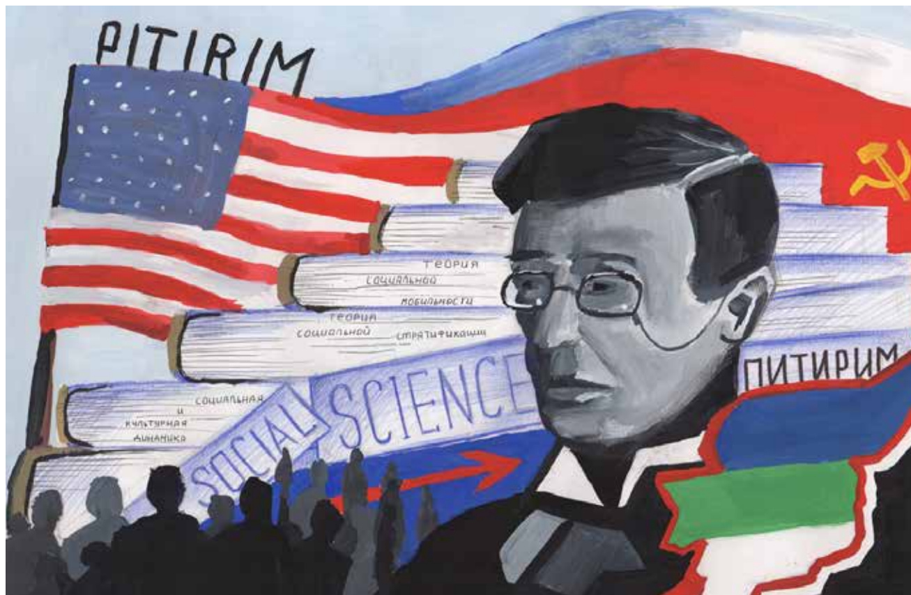
«Питириим Сорокин». Рисунок Егора КИСЕЛЁВА