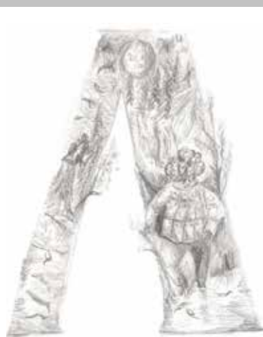
«Гундыр». Рисунок Петра Обендорфа

циях: портрет, пейзаж, иллюстрация, комикс и буква. На заданные отрывки произведений нужно было изобразить сцену или пейзажную композицию. Мифологические образы необходимо было вписать в буквицу. Проявить режиссерский талант в раскраске комикса. Передать портретное сходство известной личности, его образ жизни и достижения в области спорта, науки, литературы, искусства, политики. Ребята показали своё умение и мастерство в изобразительном искусстве, передавая красоту северных пейзажей, простоту и жизнелюбие коми народа, заслуги известных представителей нашего края, мифологические образы коми легенд и преданий.