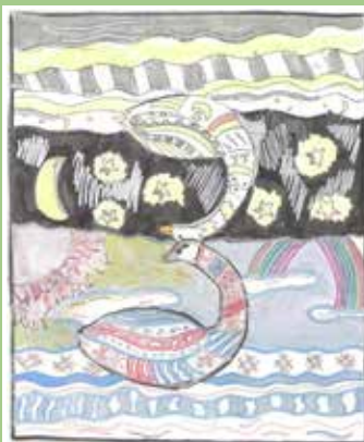
«Ен и Омёл». Рисунок Эвельны УЛЯНОВОЙ

2. Игнатова Мария Ивановна. Чужлёма 1958 воын Вильгорт грездын, олё сэні жё.