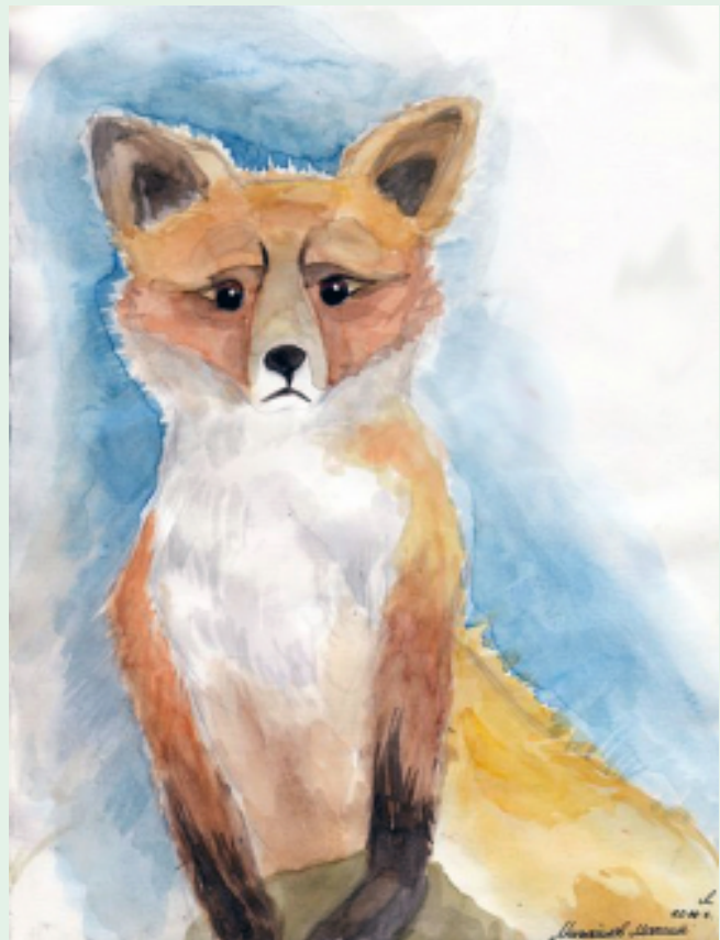
Рисунок Максима МИХАЙЛОВА

Секунду назад сияло солнце. А теперь с неба плавно летят белые мотыльки. Падают и умирают, оставляя свой след на земле, на крышах, на скамейках... Хоть мотыльки и умирают, они очень красивы. Их белизна словно чистый свет чьей-то души, открывающей нам свою красоту. У каждого из них своя история, которую они хотят поведать нам перед смертью. Все восхищаются красотой мотыльков, но мало кто их слышит. Их история удивительна и сказочна. И если хоть один человек услышит их историю, они будут умирать спокойно.